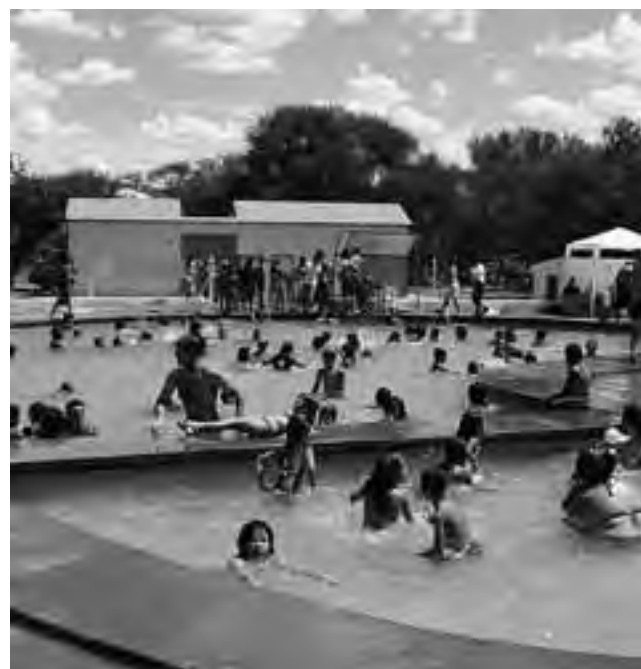
Piscina del Complejo "El Quincho de Parque Luro".