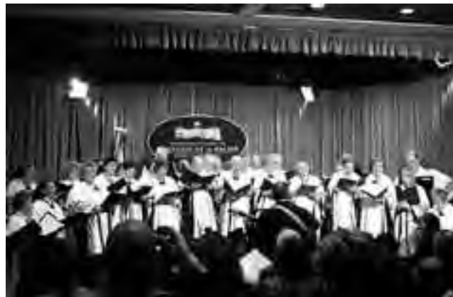
Actuación 2011 del Coro Ayuntun en el Congreso de la Nación.

El conjunto nació en 1986. Su nombre en voz mapuche significa "dar amor". A lo largo de estos 25 años de vida, el Coro Ayuntun ha participado en conciertos en las provincias de Mendoza, Santiago del Estero, Córdoba, Tucumán, Neuquén, Chubut, Buenos Aires, así como en Cuba, Chile y Uruguay. Ha actuado en salas relevantes, como el Teatro Municipal de Viña del Mar, el Honorable Congreso de la Nación de Valparaíso (Chile), y el Palacio de Convenciones de La Habana (Cuba).