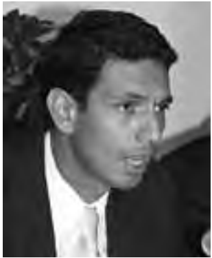
El secretario de Turismo, provincial Santiago Amsé, participó del lanzamiento del Festival en el MinTur.