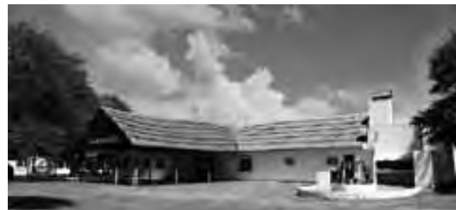
Complejo "El Quincho de Parque Luro", Restaurante, Pileta y Alojamiento.

plia zona de camping, con juegos, proveeduría, buffet y pizzería.