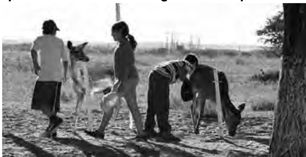
Minizoo del Club de Caza Mapú. Un paseo didáctico con 17 especies regionales.