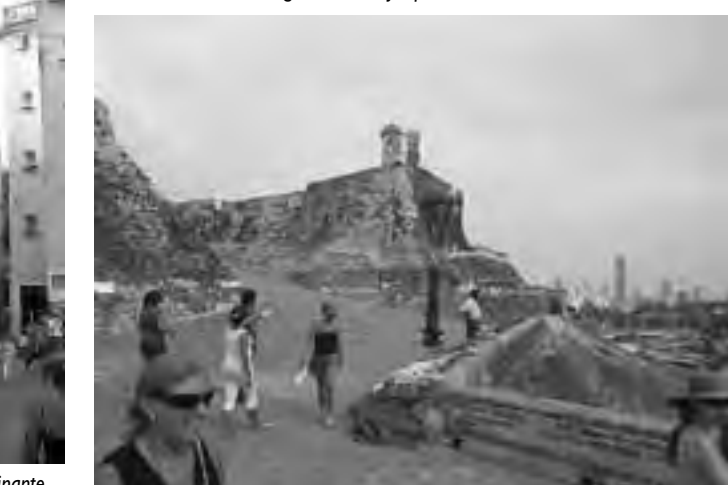
El Fuerte de San Felipe de Barajas, construido en 1657, aún perdura en todo su esplendor.