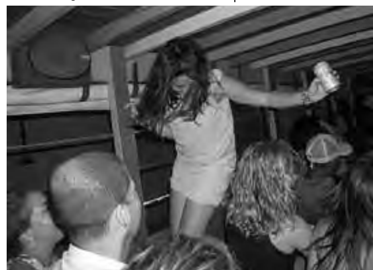
Paseo de «Rumba en chiva», música, mucha diversión y mucho ron a canilla libre deshinibe a todos los pasajeros. Si uno va en pareja lo disfruta a pleno y si la salida es de amigos, nada mejor para hacer nuevas amistades.

Las mejores playas en el área de Cartagena se encuentran en: Isla Barú e Islas del Rosario, que serán motivo de una próxima nota.