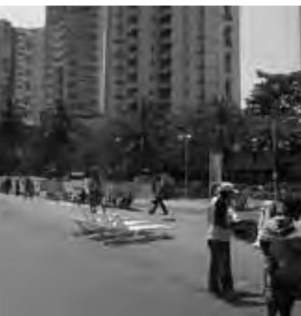
Para pasar unos días románticos o disfrutar de una vida de la historia se mezcla con la modernidad y lo típico se mezcla con la influencia de la cultura europea.

centroamericana y los mejores hoteles all inclusive.