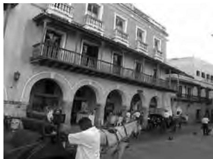
La ciudad respira sensualidad y las opciones se multiplican para el viajero. La hora es determinante para escoger entre los planes de playa, buceo o snorkeling y los de restaurantes, bares, simplemente, de romance. Cartagena es la joya del Caribe colombiano.