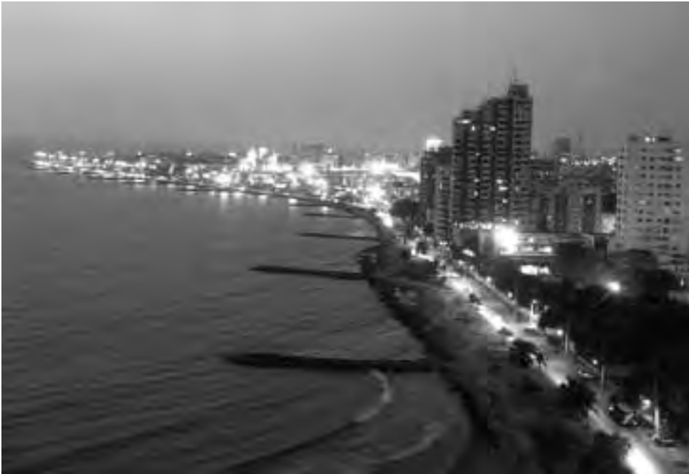
Enmarcada por una hermosa bahía, Cartagena de Indias es una de las ciudades más bellas y conservadas de América. Su temperatura media anual es de 28°. Cartagena es sinónimo de descanso y diversión. Cerca de la ciudad amurallada se encuentra un moderno sector turístico, Bocagrande, con amplias playas, hoteles, restaurantes y discotecas.

Cartagena fue sede del maléfico Tribunal de Penas del Santo Oficio de la Inquisición, alojó virreyes, fue arrasada y devastada, sufrió dramáticos bloqueos, tuvo un largo período de estancamiento y entrado el Siglo XX renació con la reactivación de su economía y dada su historia, sus leyendas y su excepcional legado edilicio de la Ciudad Amurallada o Ciudad