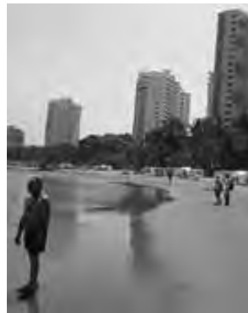
Cartagena de Indias es un destino ideal para una experiencia nocturna inigualable, un lugar mágico en donde la historia se confunde con la vida moderna.

Es un verdadero placer recorrer en carruaje la Ciudad Amurallada y observar sus casas coloniales. Cada calle