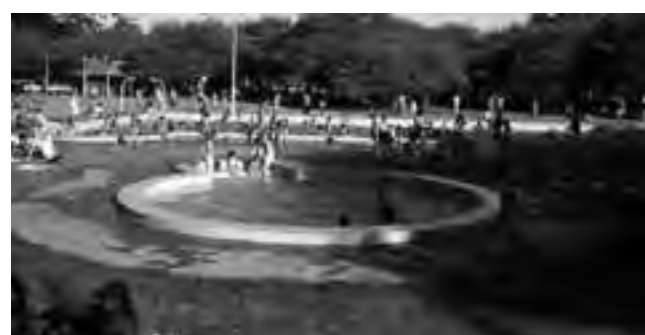
Pileta del Club de Caza Mapú. Tiene para acampar y buffet con pizzería.

realizarse visitas guiadas al museo El Castillo y conocer el moderno Centro de Interpretación.