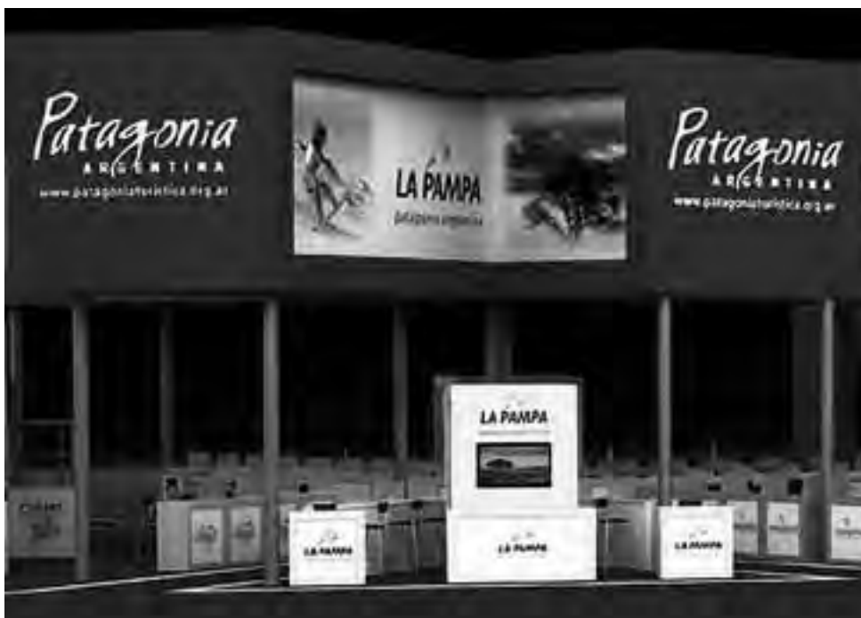
Maqueta del Stand de la Secretaría de Turismo de La Pampa en el espacio del Ente Oficial Patagonia Turística en la FIT 2011.

La Pampa contará con un stand donde, el sector público y privado, realizará la promoción de los servicios, destino y productos turísticos que ofrece para disfrutar.