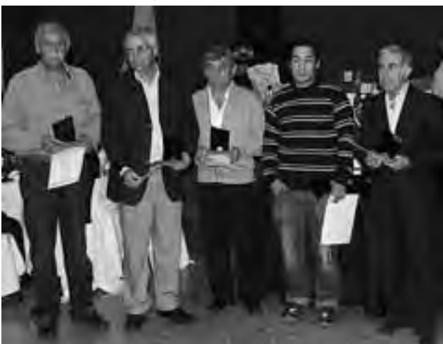
Los socios vitalicios distinguidos en la gran noche de la Cena Anual.