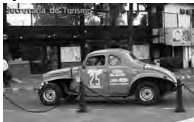
Una de las cupecitas del Gran Premio Histórico que conquistaron la admiración de los espectadores a lo largo de la carrera en toda la Provincia, a su paso por la Secretaría de Turismo de La Pampa -en la rotonda de Luro y San Martín- que impulsó la difusión de este evento del Turismo Deportivo.

El sábado 15 por la tarde, luego de la partida desde Mar del Plata, la segunda etapa culminó en Santa Rosa, donde los equipos pernataron para continuar el domingo 16 con la tercera etapa rumbo a Neuquén. Cerca de mil personas ingresaron a la ciudad con la carrera, colmando hoteles y restaurantes, consumiendo miles de litros de combustible, paseando y haciendo compras, demostrando