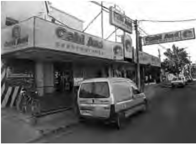
A media cuadra de donde se iniciaron, en la calle Tomás Mason, con una pequeña despensa, hoy el Supermercado «Gabi And» dispone de una amplia superficie cubierta y una sucursal en Av. Luro 65.