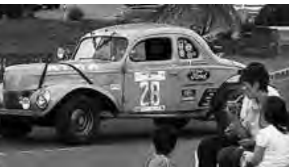
La gente disfrutó a pleno en las rutas, en los pequeños pueblos y también en la ciudad, donde hubo familias que mate en mano, se sentaron para ver pasar los autos.