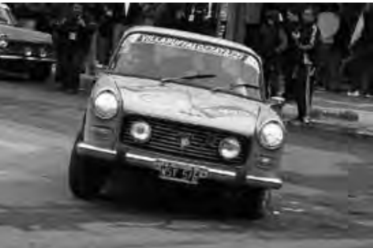
Con todo, uno de los punteros de la competencia, en el momento de la largada de la 3ra Etapa en la Plaza San Martín de Santa Rosa.

podían verse. En tanto, el domingo por la mañana, los autos partieron desde la plaza San Martín hacia la ruta 35, con destino al sur hasta la ruta 14. La caravana pasó por el autódromo que se está construyendo en Toay, luego fue a Quehué, General Acha, Lihué Calel y Casa de Piedra, para continuar viaje con destino a Neuquén.