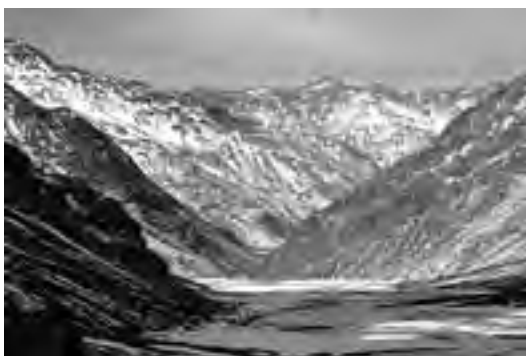
Laguna Los Pejerreyes, en Chile, desde donde se aprecia la factibilidad de la obra, varias veces millonaria.