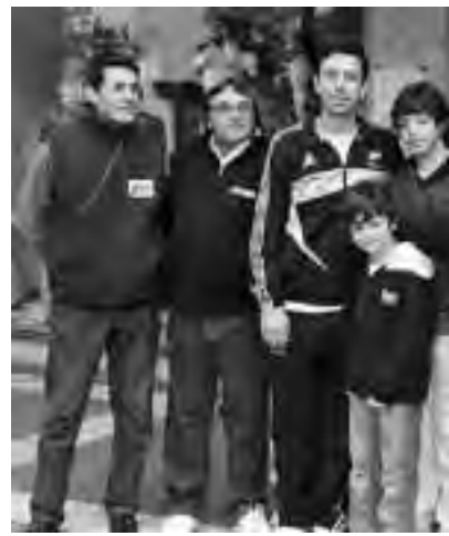
Periodistas, directivos y colaboradores de la prueba

A medida que fueron arribando, el lugar se fue llenando de público entusiasmado y admirado por los automóviles que