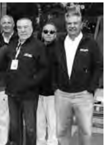
Con todo, uno de los punteros de la competencia, en el momento de la largada de la 3ra Etapa.

También, numerosa cantidad de público se acercó a los distintos caminos para saludar a los participantes y observar los