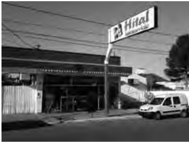
A las tres direcciones de Santa Rosa, "Hital" suma ahora una nueva sucursal en Toay.

"Autoservicio Hital" recientemente abrió sus puertas en 9 Julio 342 de Toay, La Pampa. "Hemos tratado siempre de ir mejorando la calidad de los productos que ofrecemos en nuestras góndolas y brindar un mejor servicio -dijeron desde la empresa-. Esto la gente lo ve y nos responde a diario, comprometiéndonos a seguir constantemente para dar una mejor atención. Cada una de las nuevas sucursales que hemos abierto nos pone muy orgullosos no solo por el hecho de agrandar la empresa sino también, que en cada local que abrimos generamos nuevos puestos de trabajo y más