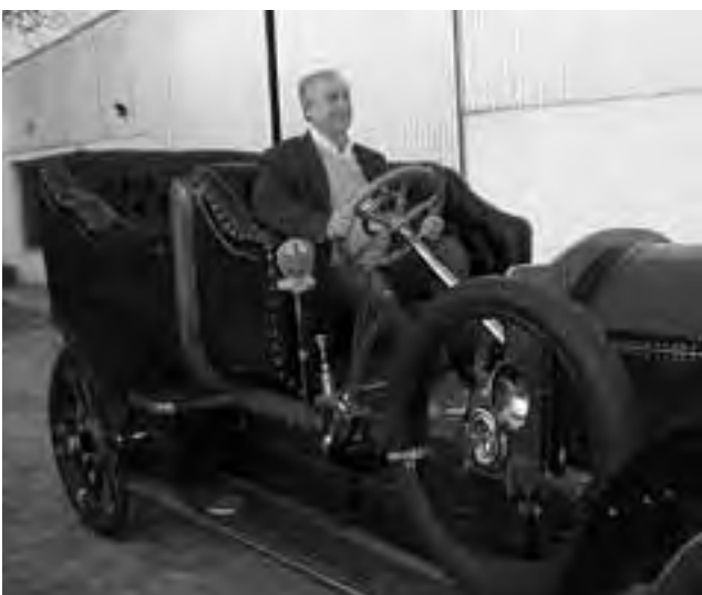
El "Gobrón-Brillie" de la familia Alvear, de 40/50 CV, es un automóvil de museo único en el mundo y será entregado a la Municipalidad norteña este sábado.

En la Secretaría de Turismo se anunció la presentación y entrega del automóvil histórico "Gobrón-Brillie", que se realizará este sábado en la localidad de Intendente Alvear. Dicho por museos de Inglaterra y de varias partes del mundo, es el único registrado y tiene un valor incalculable.