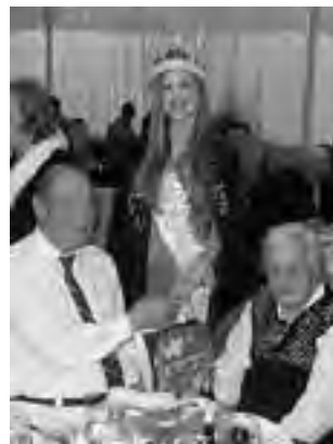
Matrimonio Giorgetto con la Reina Nacional del Mar.