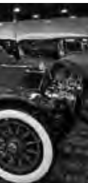
Foto del modelo de 6 cilindros 70/90 CV del "Gobron-Brillie", antecesor del auto de la familia Alvear. A pesar de su elevada potencia y sus considerables prestaciones, no tuvo éxito y fue substituido por el 4 cilindros de 40/50 CV que quedará en exposición en La Pampa.

En cuanto a la producción en serie, la marca de Boulogne-sur-Seine construyó, entre 1898 y 1903, varios modelos de automóviles, al principio con motores de 2 cilindros verticales