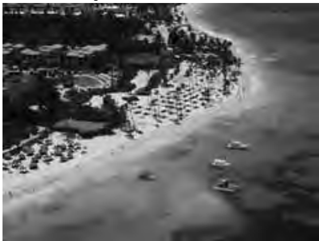
Arriba: Playa Gorda, en la zona de Bávaro, Punta Cana. Abajo, el imponente 5 estrellas "Hotel Riu Palace Punta Cana".