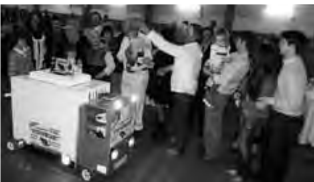
"Un camión de torta" en pleno festejo.