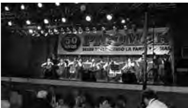
Una fiesta "a toda orquesta",