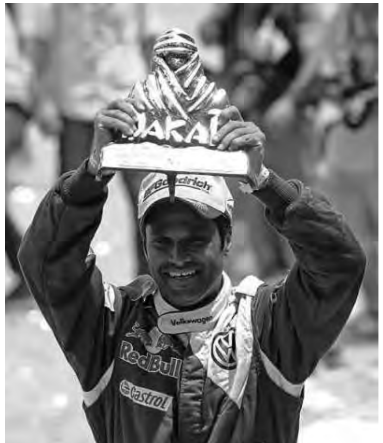
Nasser Al-Attiyah, el último campeón con el trofeo Dakar 2011. Ganó con VW, ahora corre con Hummer.

La evolución de la reglamentación decretada por la FIA invita a los constructores a diseñar vehículos con motores no modificados. Con el fin de poner coherencia en este movimiento, desde este año el Dakar crea una clase abierta a los vehículos que respondan a dichos criterios. Desde ahora, la generalización de estos prototipos llevará a una disminución de los costos y a una nivelación de los resultados que deberá atraer a nuevos constructores.