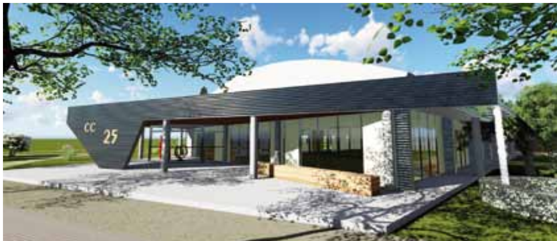
Render de la fachada del moderno proyecto para el Nuevo Centro Cultural de 25 de Mayo, una inversión de $ 16 millones.

En primer lugar se realizaron varias refacciones al habitual Centro Cultural (ex SUM). Y la etapa que viene, es la construcción del Nuevo Centro Cultural, que