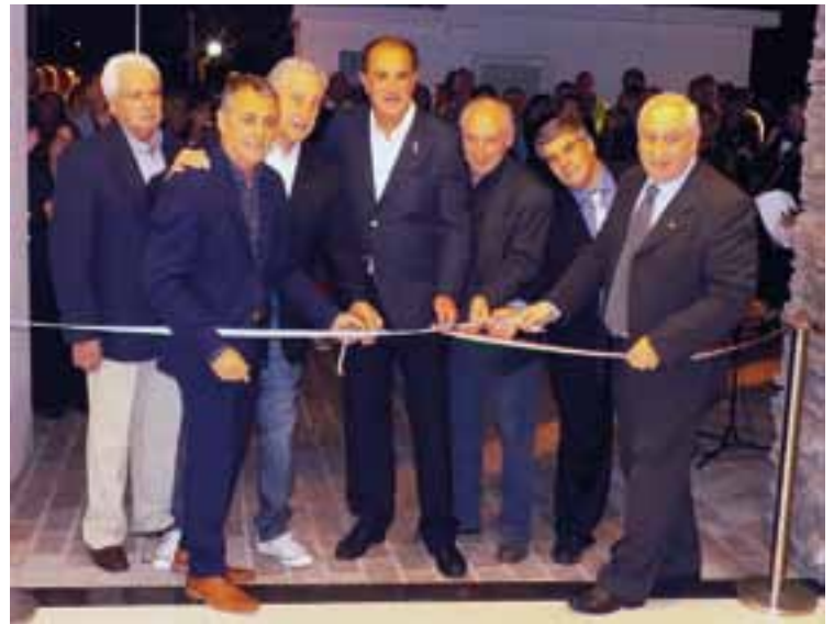
Corte de cintas inaugural de "La Fontana"

va a ser tanto para fiestas, eventos, conferencias, o cualquier otro uso que la comunidad de General Pico requiera, ya que se pueden usar los dos salones en simultáneo o por separado.