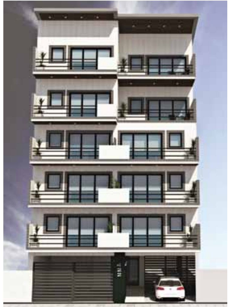
Edificio "Magdalena IV" en zona céntrica con 15 departamentos.

Mayor información: Parque Industrial Santa Rosa, en el primer predio, Calle 2 N° 2.450; también por redes sociales, o llamando al 02954 15 367 143