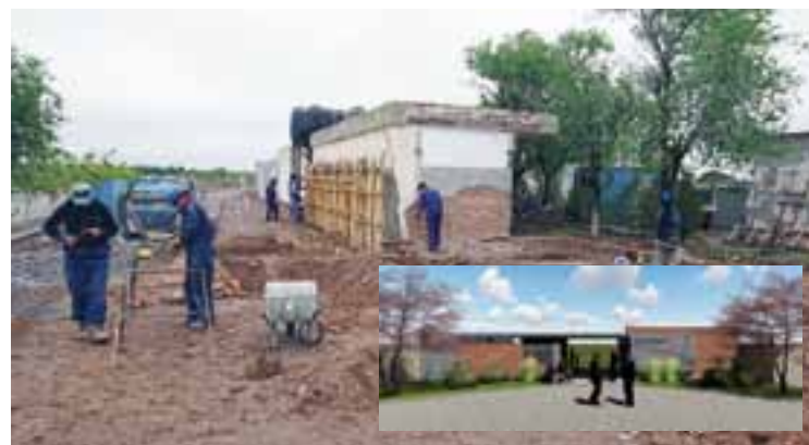
Para las obras de refacción y ampliación del cementerio local, la Municipalidad asignó un presupuesto de más de $ 7 millones de inversión.