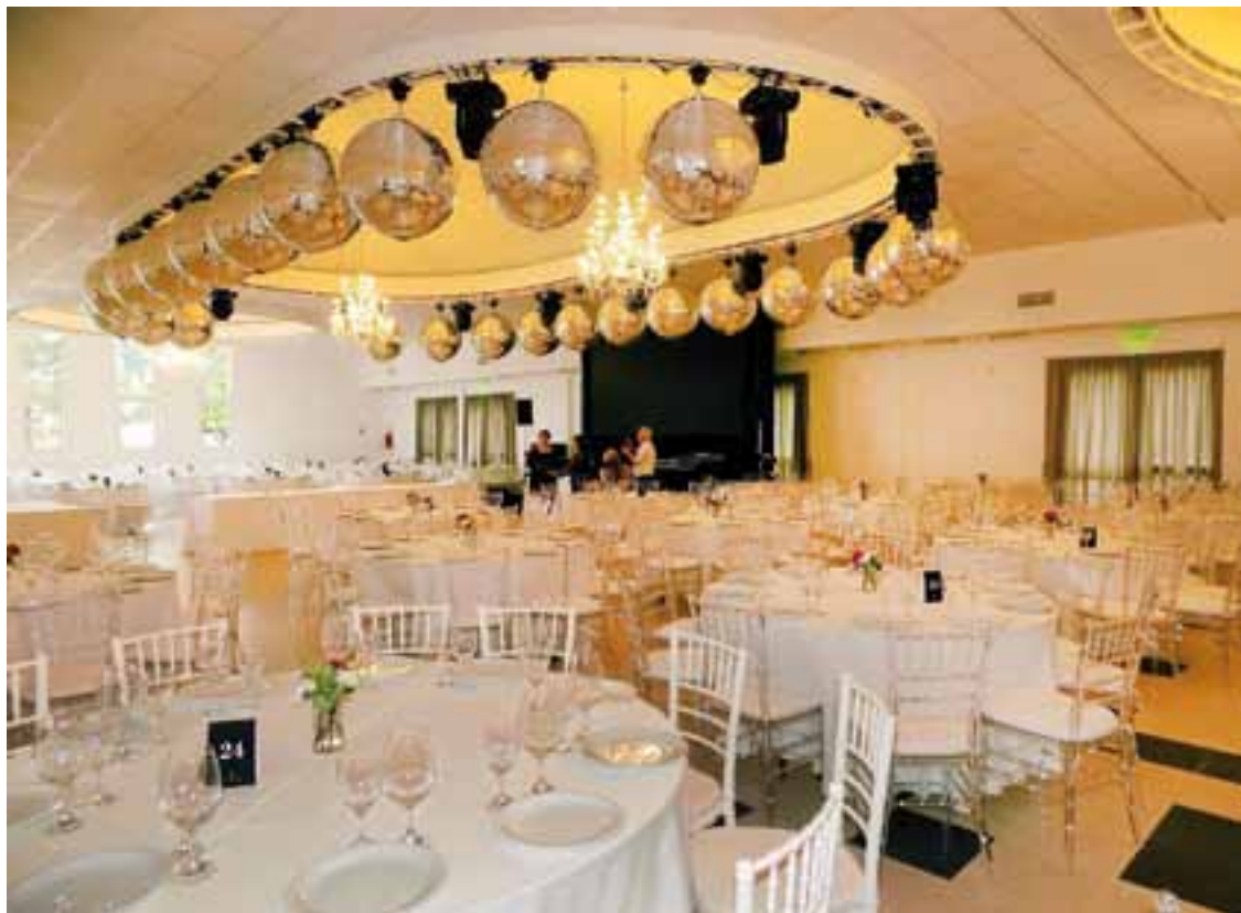
El nuevo salón de eventos de la Asociación Italiana XX de Septiembre de General Pico, sin duda marca un antes y un después en el buen nivel de infraestructura edilicia y de servicios, que debe ser imitado a partir de ahora por otras entidades de ésta ciudad y también de toda la Provincia.