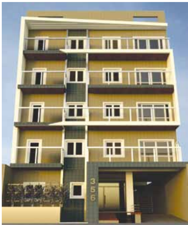
Edificio "Magdalena III" ubicado en zona céntrica con 25 departamentos.

- Magdalena III: En Olascoaga 356, a 150 metros del Parque Don Tomás y a 10 cuadras de Plaza San Martín. Se trata de un edificio de planta baja y 4 pisos, con un total