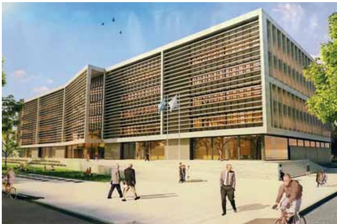
Anteproyecto ganador premiado en el Concurso Provincial de Anteproyectos del nuevo edificio judicial de General Pico.

El 11 de noviembre de 2018 General Pico recordó un nuevo Aniversario Fundacional, ocurrido en 1905.