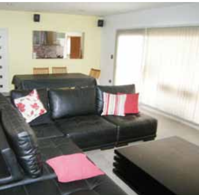
es importante en su io interior. Comedor Diario-