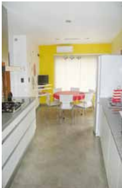
semicubierto, área de apoyatura (baño exterior, filtros, depósito, etc.) y el resto del patio destinado al área verde.