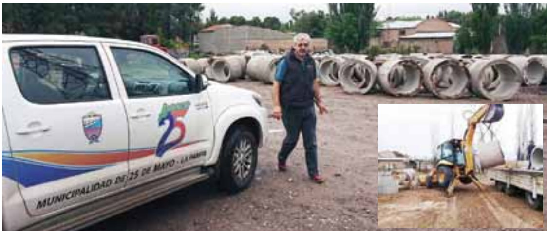
Los nuevos tramos entubados para drenaje, fueron realizados con caños de hormigón armado premoldeados de 1,00 metros de diámetro que permitirá su limpieza anual por medios manuales, evitando nuevos colapsos.

Con una inversión de casi $ 9 millones, la Municipalidad junto con la Policía de La Pampa en las dependencias de la localidad, ya llevaron a cabo obras que conforman el primer "Centro de Monitoreo de 25 de Mayo". La capacidad técnica de este centro puede cubrir la operatoria de hasta 36 cámaras de video vigi-