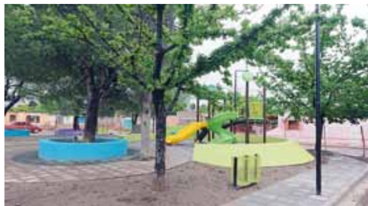
Plaza "Peludo Navarro". Obra finalizada.

El monto de todas las obras en ejecución e incipientes a desarrollar alcanzan algo más de los $ 81.100.000 sin contar todas las erogaciones que implican conexiones y reparaciones del servicio de agua y cloacas.