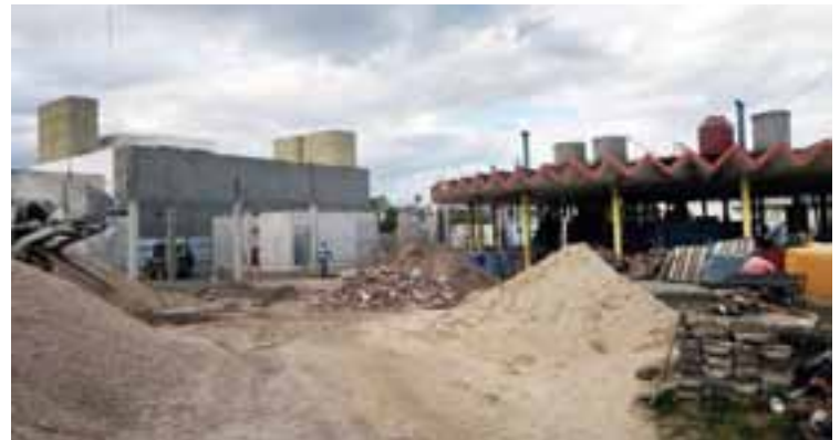
Edificio del CD y Registro Civil, actualmente en construcción.