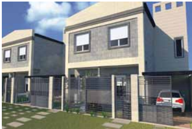
Complejo "Don Ignacio I", 10 duplex independientes de gran categoría en la esquina de Paul Harris y Grassi.

"Comenzamos a ofrecer recientemente una solución integral para quien quiera realizar un loteo -dijeron desde el Grupo Empresario-, incluyendo proyecto, subdivisión de