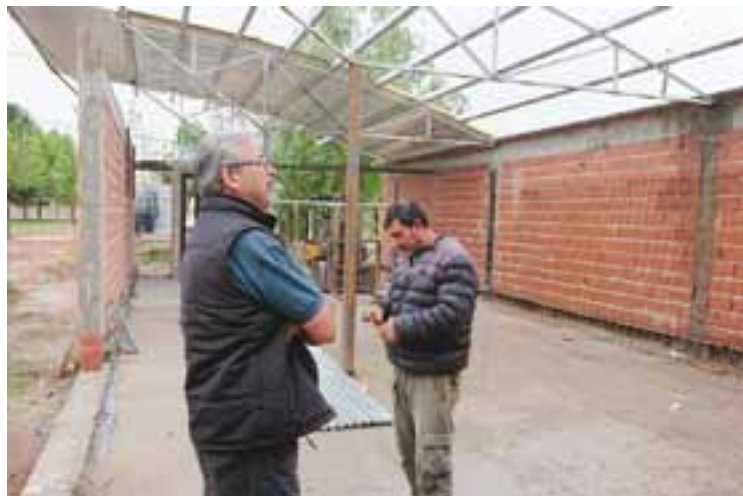
La reconstrucción general del edificio de Gestión Social de 25 de Mayo, es otra de las obras en marcha. Abajo, render del frente terminado.

Con una inversión de casi $ 3,5 millones y de manera simultánea, se comenzó con la obra de repotenciación de la red de agua potable en la zona de quintas de hectárea y media, consistente en modificación de manifold de impulsión y recambio de cañerías en algo más de 4.000 metros con